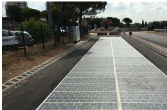
Septème-les Vallons DIRMED